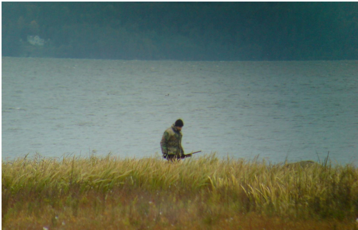
Jägare inom naturreservatet vid Sättunaviken 21 september 2009.

Vid flera tillfällen under sommaren och hösten 2009 har jakt förekommit i och intill gränsen till Svartåmyrningens naturreservat vid västra Roxen utanför Linköping. Stora mängder grågäss, änder, tofsvipor och rastande vadare har skrämts bort från Sättunaviken. Vid ett tillfälle såg Adam Bergner hur fyra(!) jägare smög omkring i vegetationen och sköt. Redan i mitten av juli såg undertecknad hur jägarna har stod och sköt cirka 100 meter från reservatsgränsen vis Sättuna, som här går mycket nära stranden.