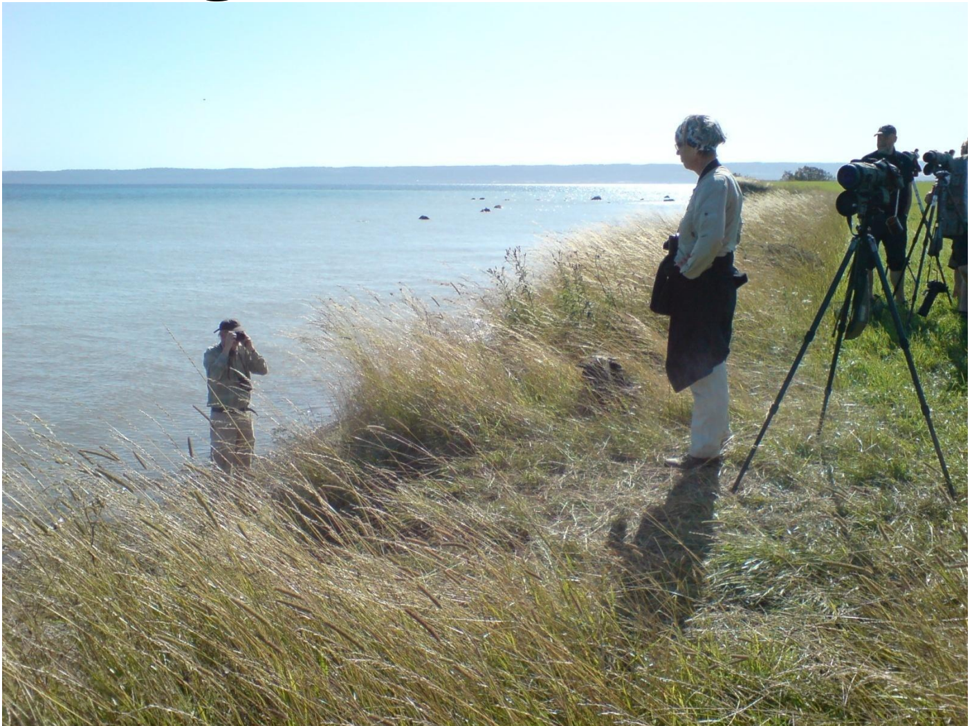
Norra Visingsö.

Tre skådare från Linköping tog färjan från Gränna till Visingsö lördagen den 1 augusti. Ellen Hultman hälsade oss välkommen vid fågeltornet nära Erstad kärr. Vädret: 20 grader varmt, 2 m/s sydvästlig vind och medljus på morgonen. Ellen presenterade två skådare från Jönköping. Vi från Linköping fick god hjälp från våra värdar att artbestämma fåglarna.