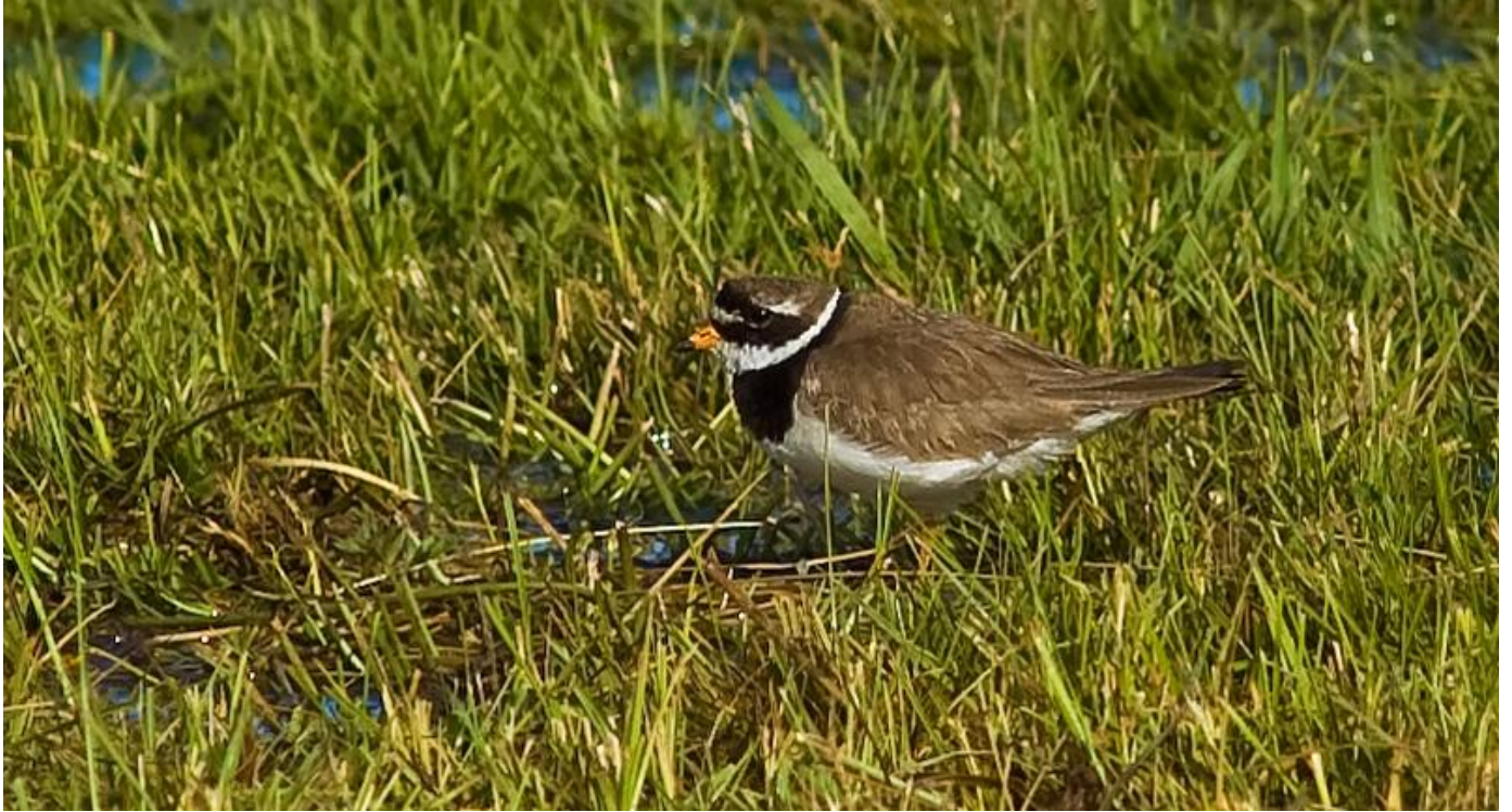
Större strandpipare vid Nybro, Svartåmynningen.

skillnaden i antalet revir så stort mellan år 2006 och 2009.