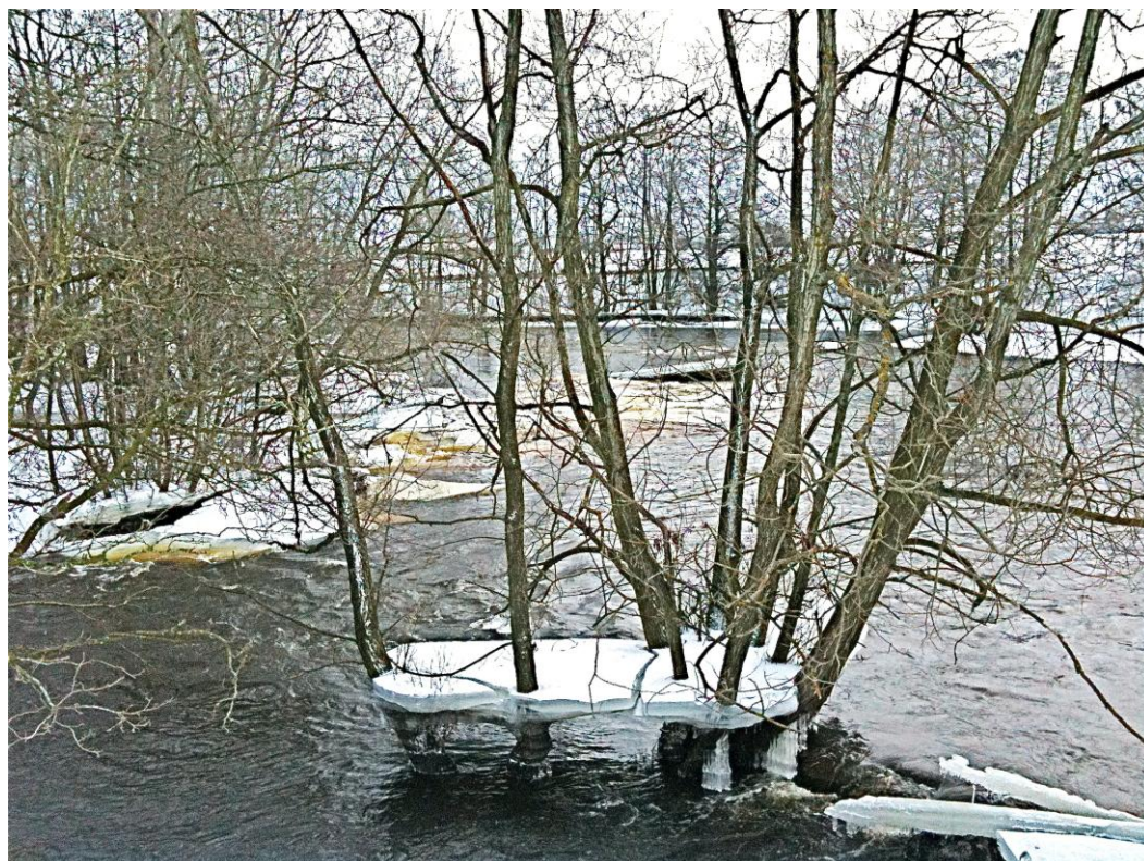
Svartån vid Brickstad i vintertid