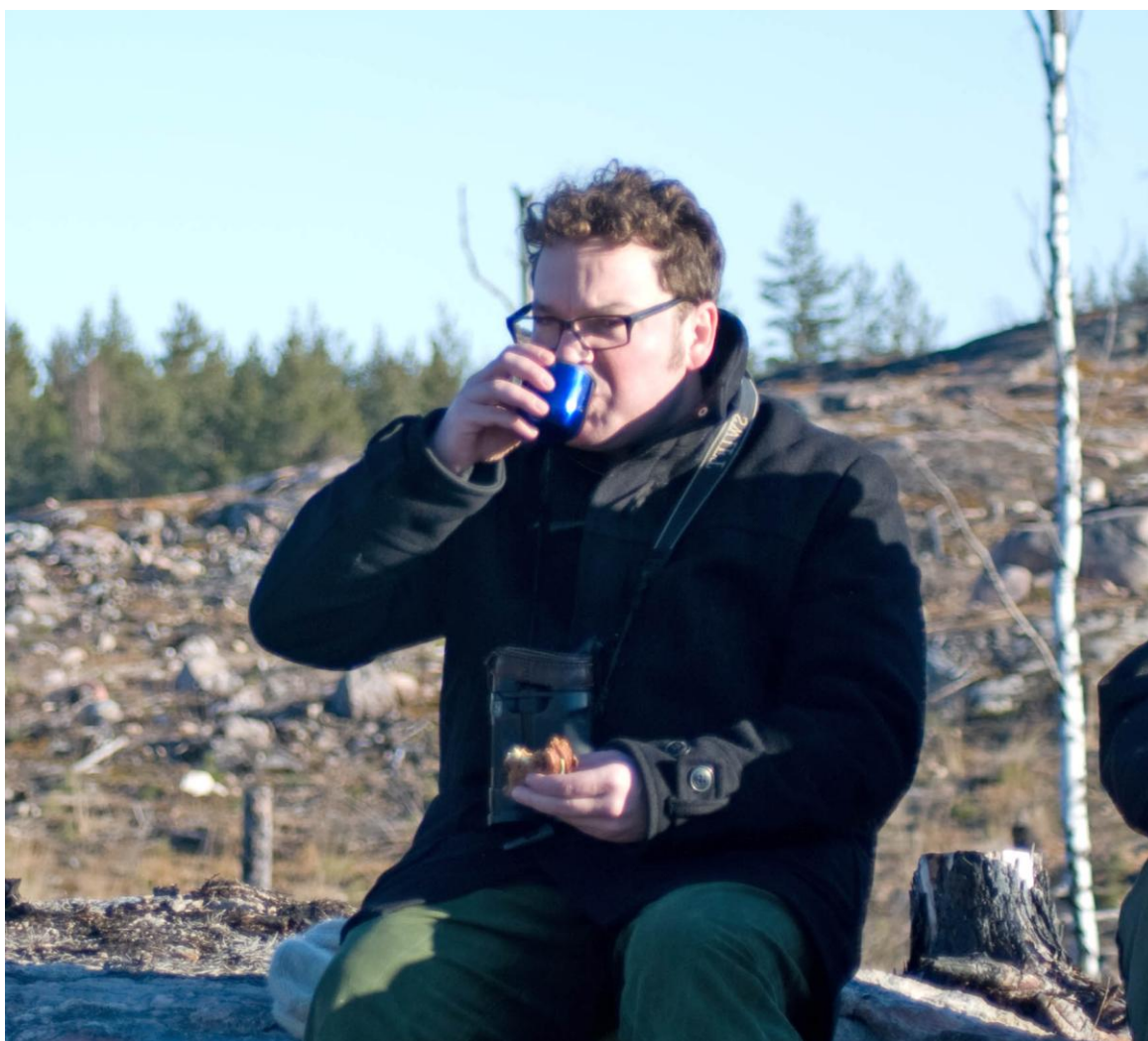
Ännu mer fika, nu med bulle