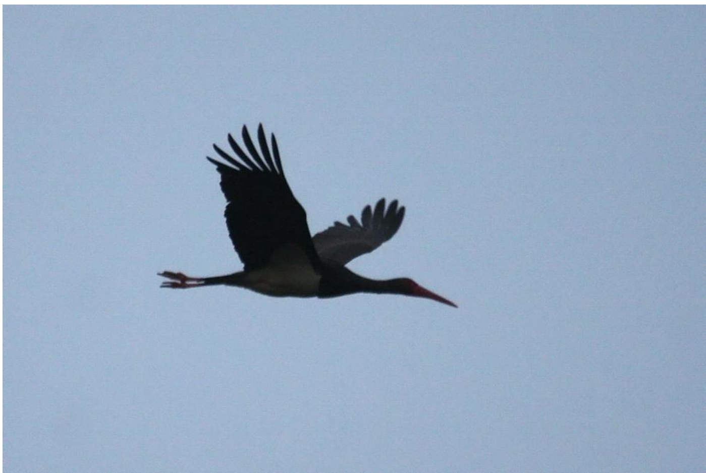
Svart stork vid Prästtomta skjutfält.