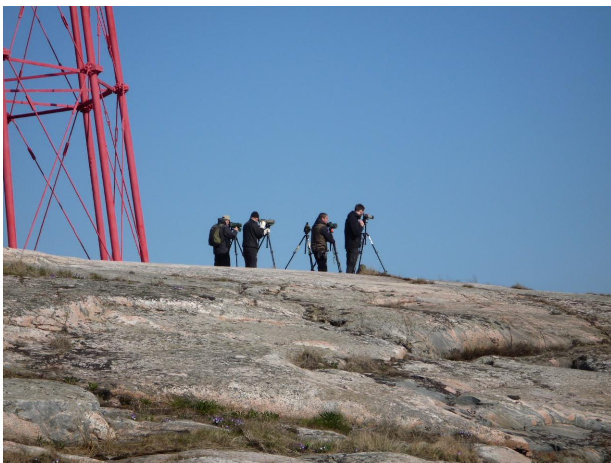
Fågelspaning från välbekant fyrplats