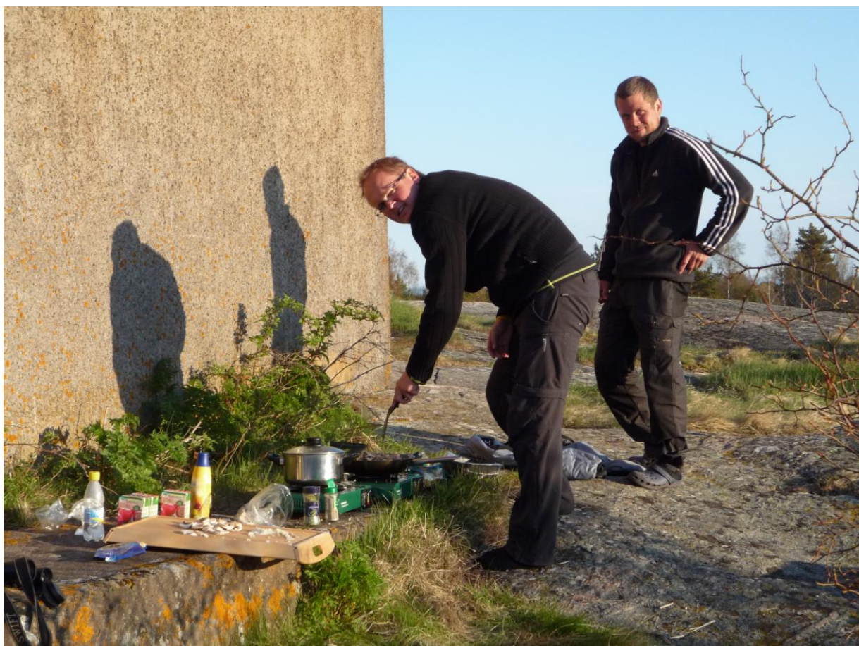
Solig matpaus på Häradsöskär