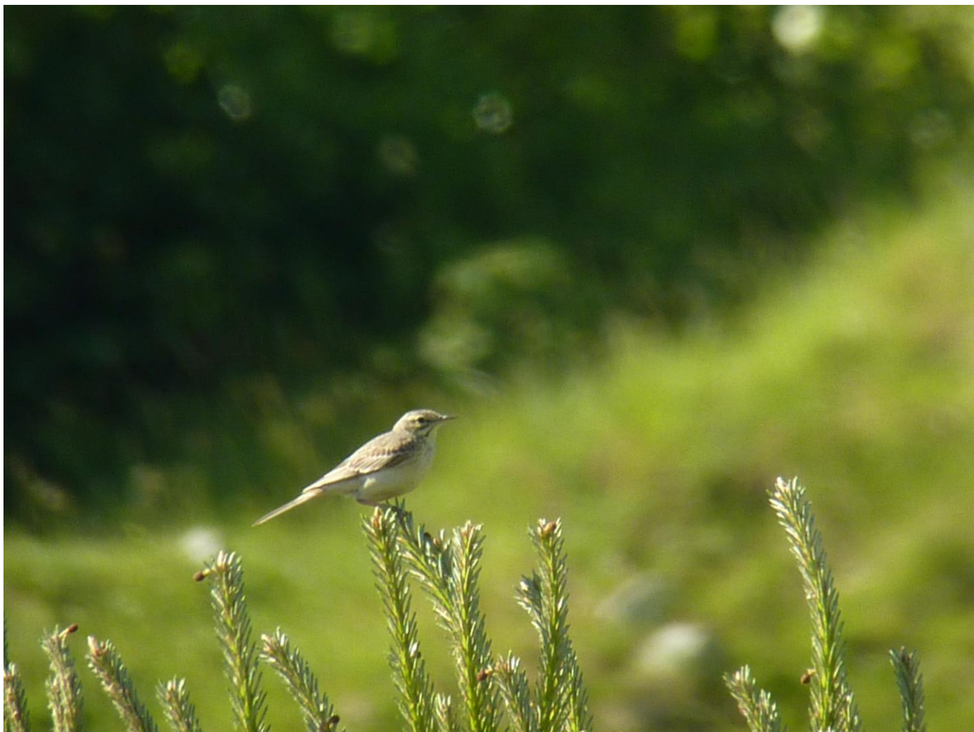
Fältpiplärka på Ravlunda skjutfält.

Lördag 4 juni: Tidig uppstigning igen (04.30) och iväg till Kåseberga för att se om en av Sveriges bästa sträcklokaler hade nåt att erbjuda den här morgonen. Nja, fick väl svaret bli, men å andra sidan är inte försommaren den mest intensiva sträcktiden. Fyra prutgäss gladde, liksom flera nya researter som tordmule , sjöorre och svärta . En rosenfink sjöng ljudligt och ihärdigt från dungen. Den bästa obsen kom istället från själva byn där en sjungande svart rödstjärt underhöll. Vi lämnade Kåseberga och körde bara någon kilometer västerut, runt och i den lilla byn Hammar har ju kornsparven sitt starkaste fäste i Sverige. Vi letade en stund, och läget hann bli lite oroligt hos vissa deltagare innan en kornsparv plötsligt flög upp på en tråd precis över oss och började sjunga för full hals! En av resans bästa observationer. Med humöret på topp fortsatte vi in mot Ystad där en gulhämpling sågs och hördes. Arten har ökat i södra Sveri-