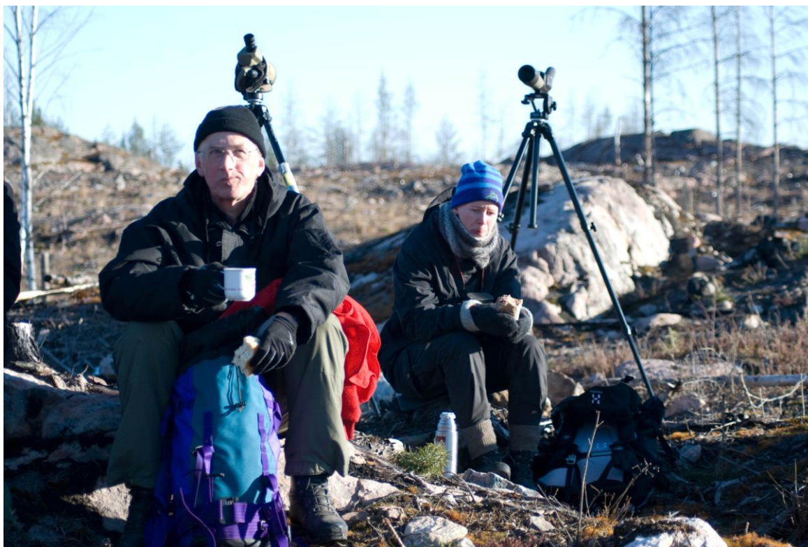
Skön fika på Gölmosse